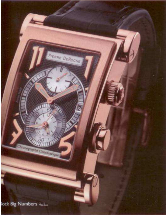
ساعة SplitRock Big Numbers