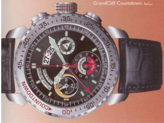
ساعة GrandCliff Countdown